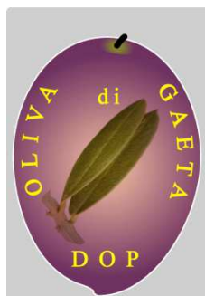
Il logo del Consorzio di Tutela e Valorizzazione dell'Oliva di Gaeta D.O.P.